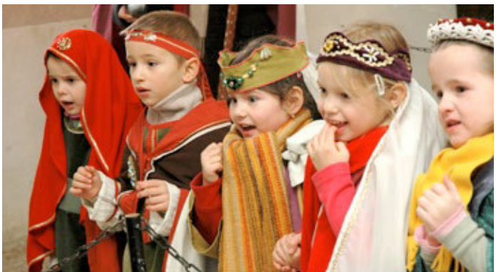
Kinderkemenate im Schloss Neuenburg

Wie könnte ein so erlebnisreicher Tag schöner ausklingen als beim Lagerfeuer mit urigem Stockbrot und lustigen Geschichten, z. B. im Jugend- und Sporthotel Euroville Naumburg oder im Waldhof Görtschen.