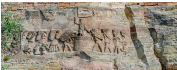
Steinernes Bilderbuch Großjena