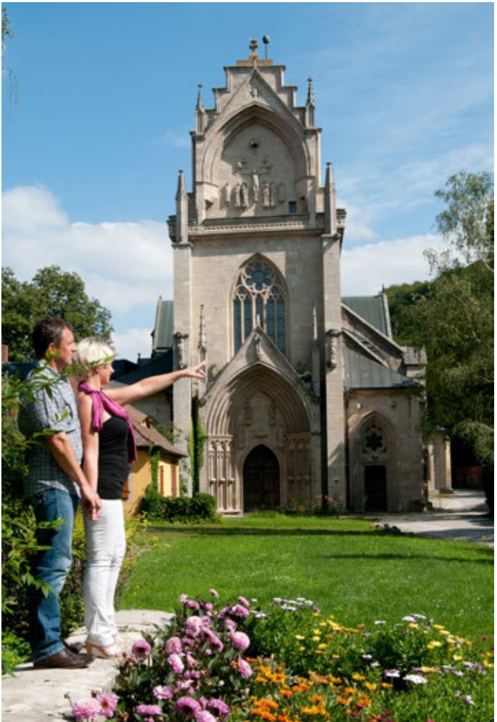
Ehemaliges Zisterzienserkloster Pforte

Eingebettet in der Kernregion Saale-Unstrut liegt das Bäderdreieck, bestehend aus den Orten Bad Bibra, Bad Kösen und Bad Sulza. In den Orten stehen dem Gast zahlreiche touristische Angebote, in Verbindung mit den Themen Gesundheit, Kur und Wellness zur Verfügung.