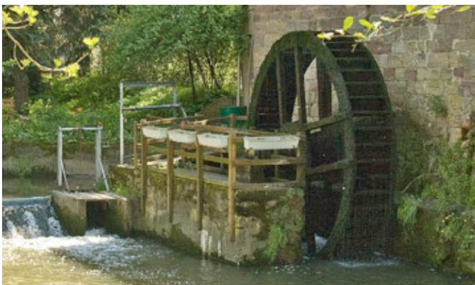
Neumühle im Kroppental bei Schönburg