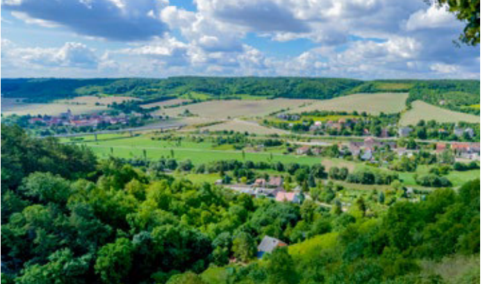
Blick in das Unstruttal