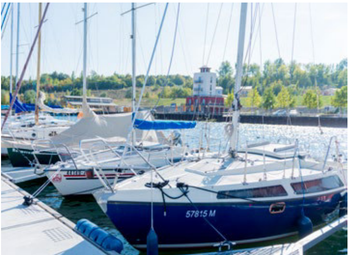
Bootsanleger an der Marina Mücheln