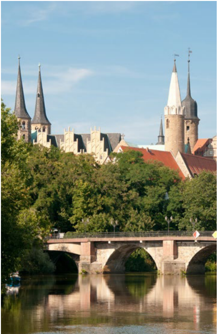
Merseburger Dom- und Schlossensemble

Die imposanten Schlossanlagen beinhalten Ausstellungen, die die Blütezeit dieser Residenzschlösser mit kulturhistorischem Erbe darstellen. Im herrlichen Umland locken weitere sehenswerte Ziele zu Ausflügen an.