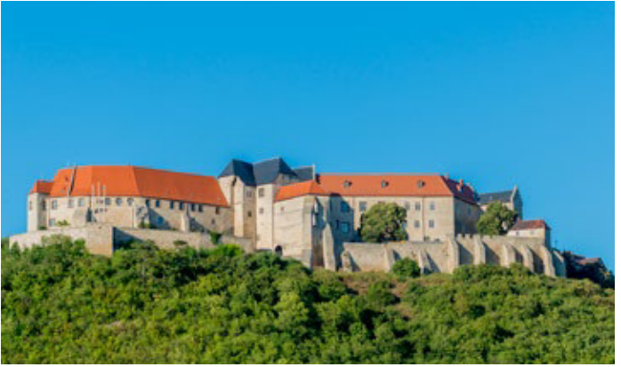
Schloss Neuenburg Freyburg