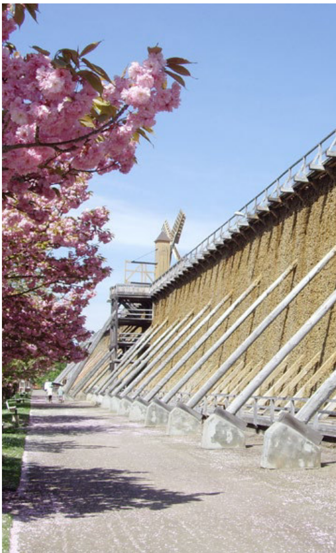
Gradierwerk Bad Dürrenberg

Im Städtedreieck zwisch Halle an der Saale, Leipzig und Naumburg liegt der staatlich anerkannte Erholungsort Bad Dürrenberg – die Stadt mit dem Salz in der Luft. An einer Kombination von etwa 8000-jähriger Siedlungsgeschichte, Sole und Gradierwerk, Kultur sowie Natur erfreuen sich vor allem Tagesausflügler und Radler-Freunde.