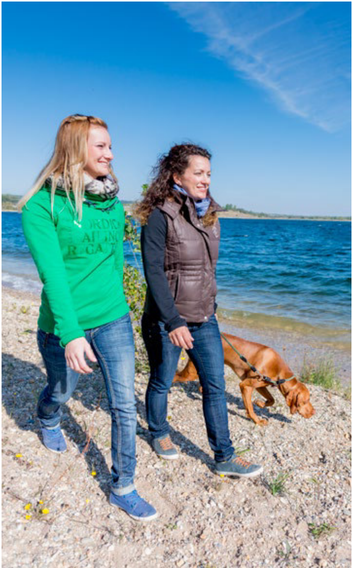
Spazieren am Geiseltalsee

In idealer Landschaft gelegen, befindet sich der größte künstliche See Deutschlands - der Geiseltalsee. Besucher können sich am, im und auf dem See erholen. Das Naherholungs-, Urlaubs- und Wassersportgebiet lädt mit seinem ca. 30 km langen asphaltierten Rad- und Wanderweg, welcher um den See führt, zu Erkundungen ein.