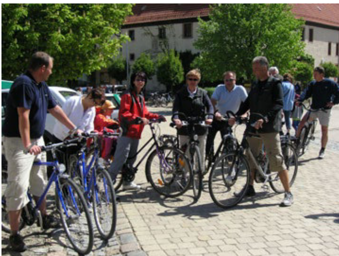
Anradeln an der Weißen Elster bei der Haynsburg

Wenn man im Droyßiger-Zeitzer Forst und Wethautal unterwegs ist, passiert man attraktiv abwechslungsreiche Landschaftsgebiete mit dörflich geprägter Lebenskultur und traditionellem Landleben. Einladend gelegen zwischen Naumburg und Zeitz präsentiert sich der Droyßiger-Zeitzer Forst und das Wethautal, als ein abwechslungsreiches Landschaftsgebiet mit dörflich geprägter Lebenskultur und traditionellem Landleben. Durch gute Verkehrsanbindungen und über die Saale-Unstrut-Elster-Radacht haben Besucher die Möglichkeit, einheimische Betriebe, die ihre Produkte direkt vermarkten, zu besuchen.