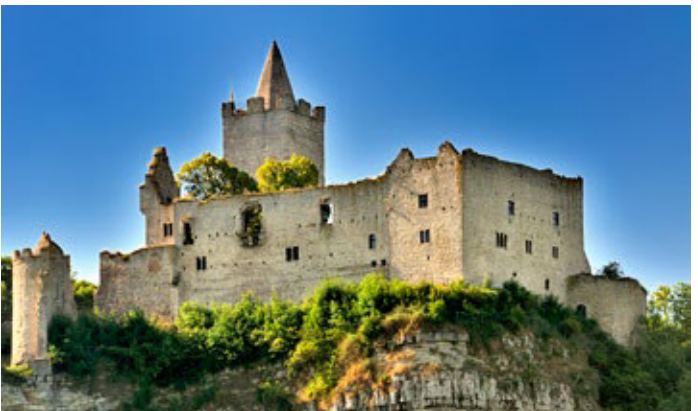
Rudelsburg Bad Kösen